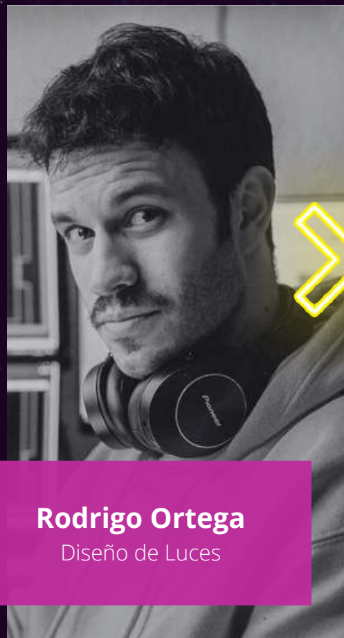
Rodrigo Ortega Diseño de Luces