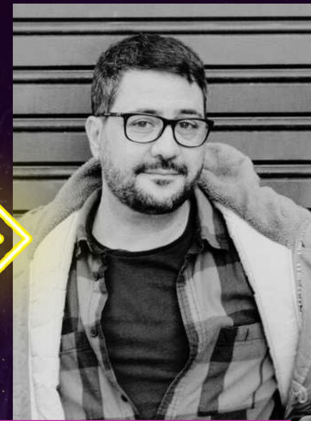
Benja de la Rosa Autor